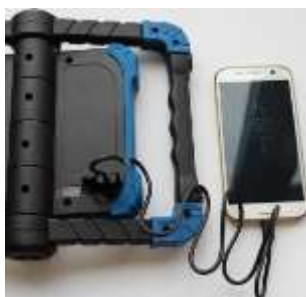
obr. 5: použití jako Power-Bank