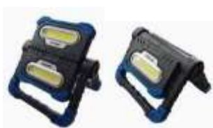
obr. 2: různé pozice LED lamp