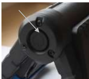
obr. 3: ovládací tlačítko